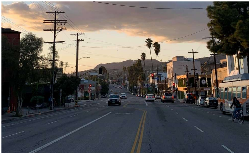
Los Angeles, USA