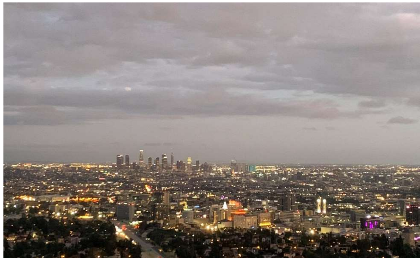
Los Angeles, USA